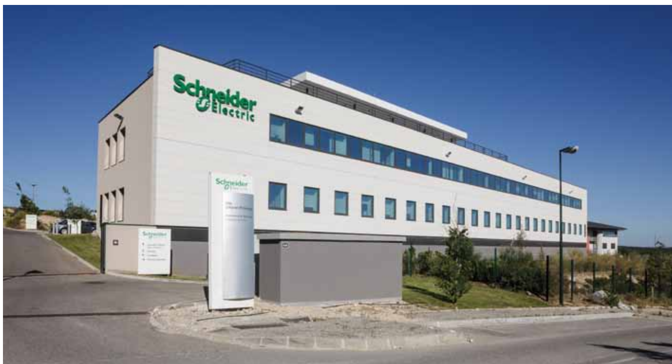
Photo Aix Galilée - immeuble de bureaux - 450, avenue Galilée à Aix en Provence (acquisition Allianz Pierre)

Un tel contexte devrait peser sur les taux de vacance, et la relative stabilité des loyers affichés ne saurait cacher la recrudescence des mesures d'accompagnement telles que franchises, travaux de rénovation et autres gestes de nature à permettre d'attirer ou de conserver les locataires. Dans une telle période, également marquée par la forte tension sur le marché de l'investissement locatif, plus que jamais les investisseurs se concentrent sur l'amélioration de la qualité du patrimoine existant en vue du maintien ou de l'amélioration des performances financières.