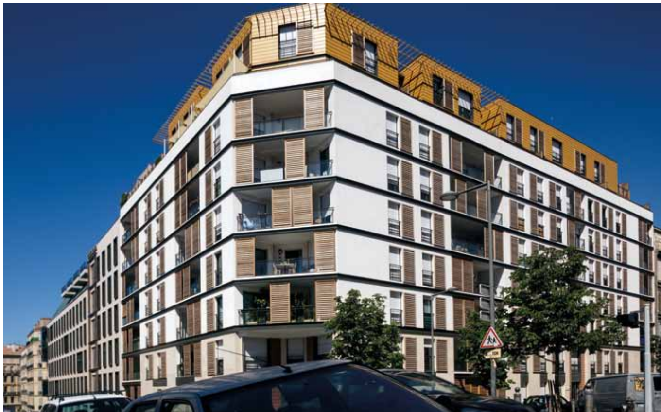
Photo Marseille - immeuble du 36 rue Fauchier à Marseille (acquisition de 14 appartements + parkings pour Domivalor 4, livrés en mars 2011)

En attendant la mise en œuvre de solutions nouvelles aux tensions liées à l'insuffisance des logements préconisées par les nombreux livres blancs publiés depuis le début de l'année, l'impact des mesures déjà en vigueur sur les revenus des SCPI « fiscales » sera relatif car certaines d'entre elles voyaient déjà leurs loyers plafonnés ; la répartition des risques locatifs offerte par les SCPI pourrait encore augmenter leur attrait par comparaison avec les achats individuels.